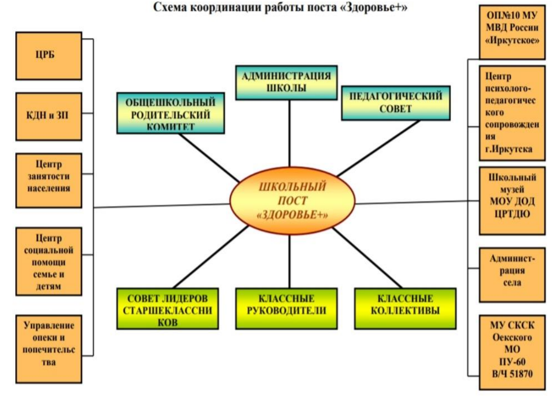
Схема координации работы поста «Здоровье+»